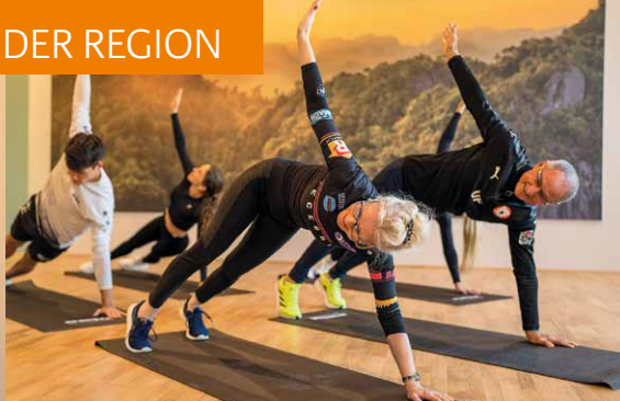
Jede Woche werden über 1.300 Kurse und Workouts angeboten.

Workouts bei Pfitzenmeier. Von TRX bis Bodega Moves und Yoga bis Bauch, Beine, Po findet jeder genau das Richtige. Und dann ist da noch der Aqua Dome, ein wahres Schmuckstück für alle Fitnessbegeisterten. In der Schwimmhalle, die es in den Premium Resorts gibt, finden Kurse auch im Wasser statt. Weniger anstrengend? Mitnichten, denn der Wasserwiderstand macht es nicht einfacher, das wohltemperierte Nass sorgt allerdings auch dafür, dass das Training gelenkschonender ist. Pfitzenmeier bietet ein ganzheitliches Konzept und vor allem viele Möglichkeiten, die Fitness-Revolution zu starten. Die Zeit für Veränderung ist gekommen, die Nummer eins in Sachen Fitness, Wellness und Gesundheit stellt die benötigten Mittel und Wege bereit.