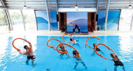
Der Aqua Dome ist ein wahres Schmuckstück für alle Fitnessbegeisterten.