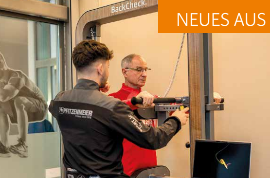
An hochwertigen Geräten stehen Experten parat und helfen bei Bedarf.